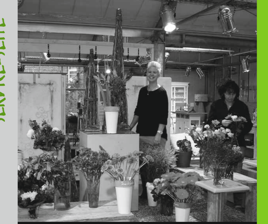
In der Dorff-Gärtnerei wird es Frühling.