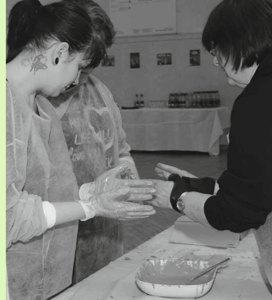
Auch Handschuhe sind kein hundertprozentiger Schutz.