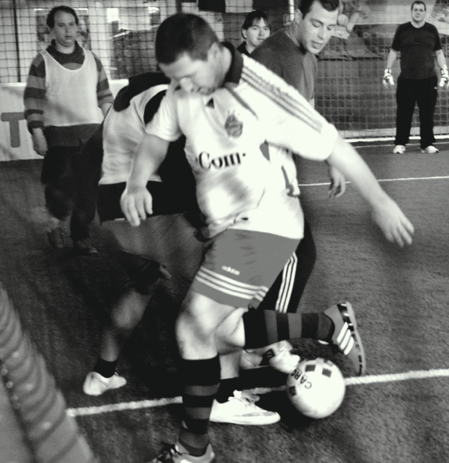
Fußball als erfolgreiche Facette der Therapie.