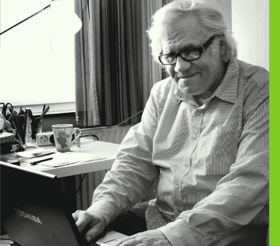
Schreiben und andere Menschen bedeutet für ihn: am Leben bleiben.

knapp zehn Jahren angefangen zu trinken. Warum? Man könnte sagen: Schlechte Kindheit. Doch das war“ zu einfach. Ich habe zwar die Schläge meines Vaters genießen dürfen. Er war Alkoholiker und jeden Abend betrunken, und dann ging es los. Meine Strategie war irgendwann, ihm den Schnaps wegzutrinken. So begann das mit dem Saufen.“ Sein Leben, sagt er, sei total irre. „In der Buchhandlung würde so ne Geschichte unter ‚Märchen‘ stehen. Das glaubt keiner.“ Ein „Achterbahnleben“ habe er hinter sich, sagt Christen: „Ich war ganz unten, und ich war ganz oben. Mir war das Mittelmaß abhanden gekommen. Hab auch viel Geld in der Spielbank gelassen und ne Wohnung gekauft und wieder verzockt ...“ Trotz Alkoholproblematik hatte er erfolgreich eine Ausbildung als Bürokaufmann absolviert, war schon mit 18 Filialleiter in einem Möbelgeschäft geworden, auch mal Einkaufsleiter in einem großen Autohaus in Bremen. Am Abend hatte er sich in Computerkursen weitergebildet und irgendwann zusammen mit seinem Bruder eine eigene Werbeagentur aufgemacht. „Ich hab zeitweise Geld ohne Ende verdient“, sagt der ath-