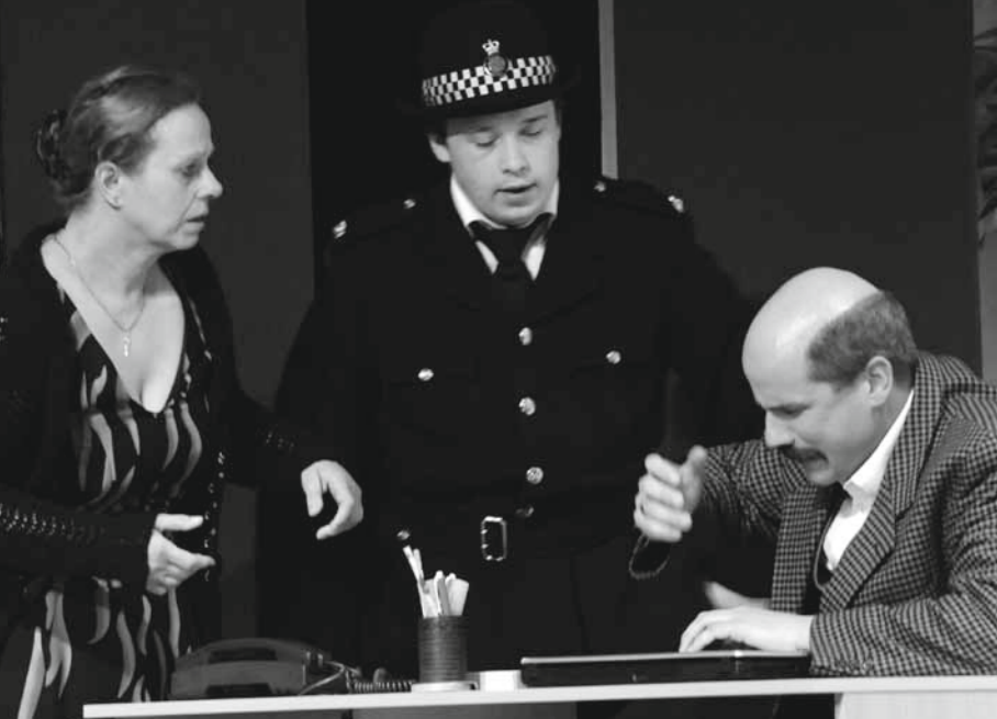
Spannung bis zur letzten Minute.