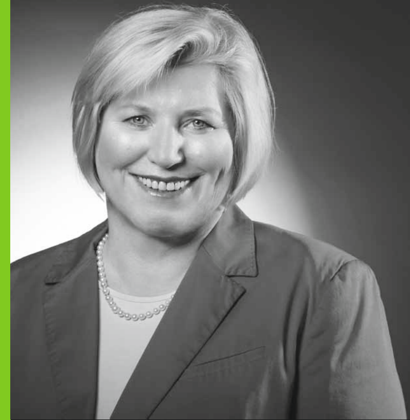
Sozialministerin Cornelia Rundt