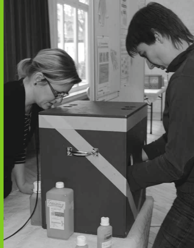
Unter Schwarzlicht kommen Hygienelücken zu Tage.